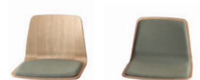
— Upholstered seat pad Asiento tapizado