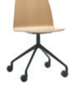
Aluminum swivel base Base giratoria de aluminio + casters / ruedas