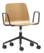
Aluminum swivel base Base giratoria de aluminio + arms / brazos + casters / ruedas + gas lift / elevación gas