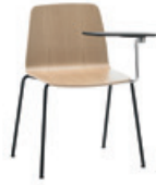
4 leg 4 patas + writing tablet / pala escritura