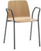
4 legs armchair Sillón 4 patas