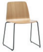
Sled base Pie de varilla