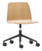
Aluminum swivel base Base giratoria de aluminio + casters / ruedas + gas lift / elevación gas