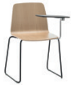
Sled base Pie de varilla + writing tablet / pala escritura