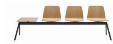
Bench 2-5 seater Banco 2-5 plazas