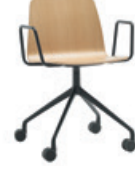
Aluminum swivel base Base giratoria de aluminio + arms / brazos + casters / ruedas