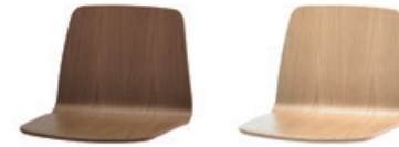
— Walnut shell Carcasa de nogal