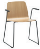
Sled base armchair Sillón pie de varilla