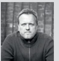
VARYA WOOD Designed in London by Simon Pengelly www.simonpengelly.com