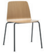
4 leg Silla 4 patas