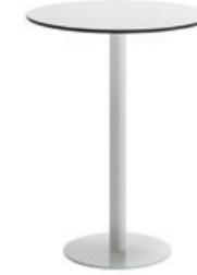
47cm round base - H.103 Base redonda de 49cm - H.103