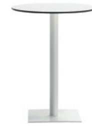
48x48cm square base - H.103 Base cuadrada de 48x48cm - H.103