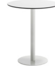
47cm round base - H.88 Base redonda de 49cm - H.88