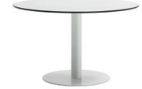
65cm round base - H.72 Base redonda de 65cm - H.72