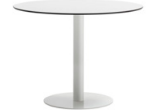
65cm round base - H.88 Base redonda de 65cm - H.88