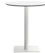
48x48cm square base - H.88 Base cuadrada de 48x48cm - H.88