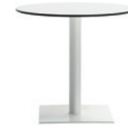
48x48cm square base - H.72 Base cuadrada de 48x48cm - H.72