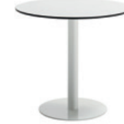
47cm round base - H.72 Base redonda de 49cm - H.72