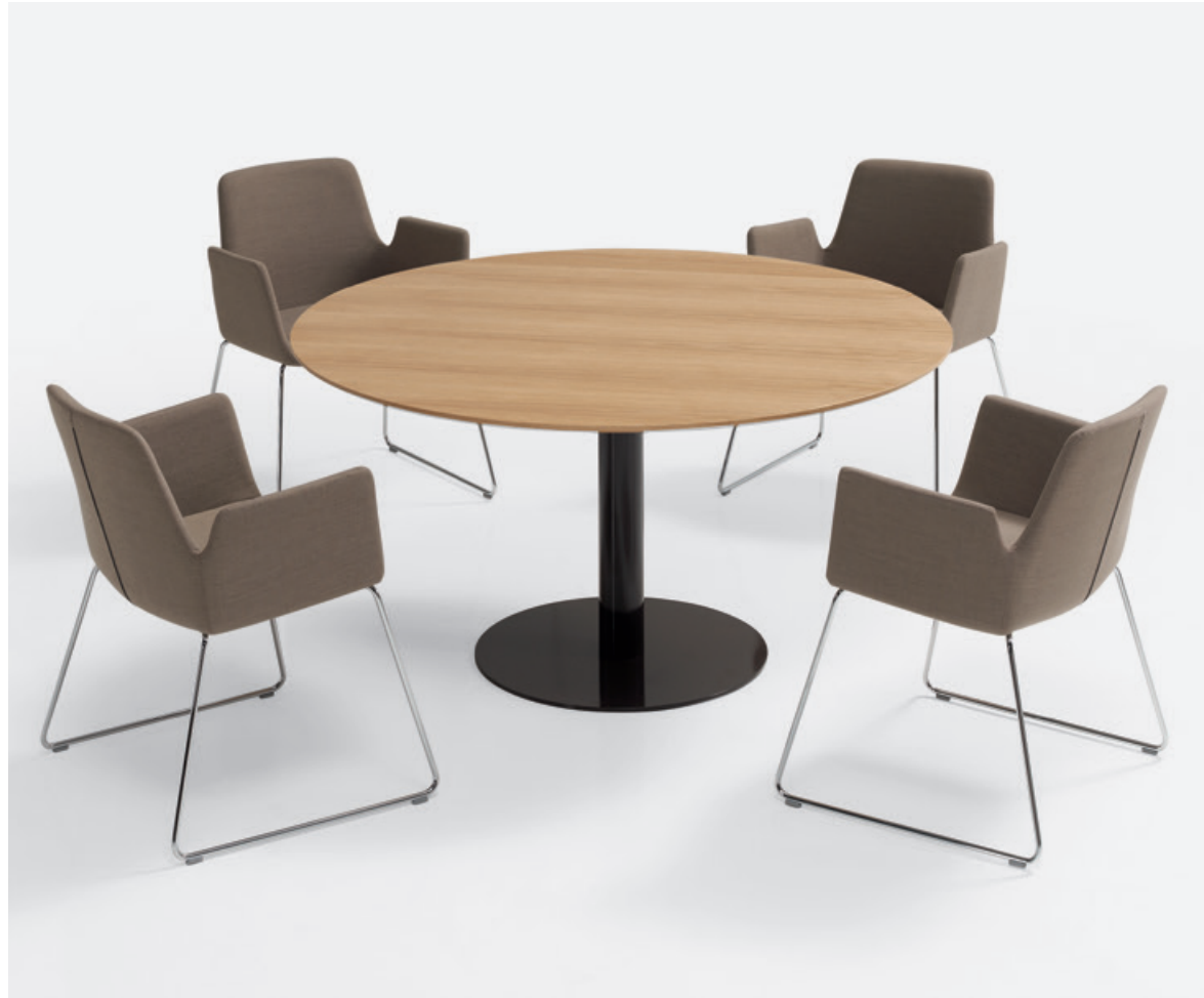
Table Tops / Tapas de Mesa