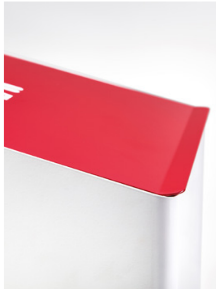
LID DETAIL — BER 03 T 9003 + 3027