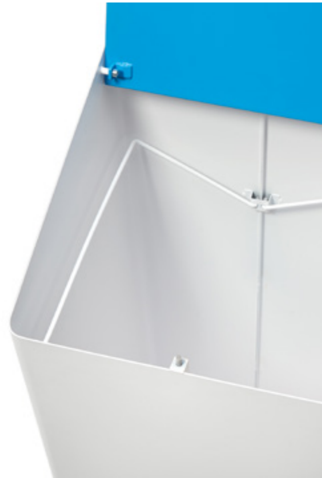
BAG RING DETAIL — BER 02 T 9003 + 5012