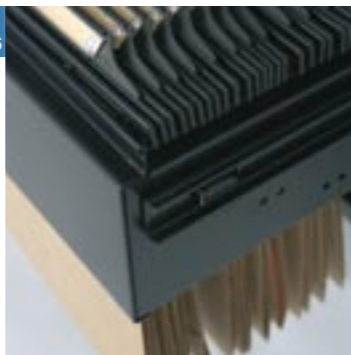
Bastidor extensible con antivuelco incluido Bastidor extensible amb anti-volcatge inclòs Extendable frame including non-capsizing Châssis extensible avec anti-retournement inclus